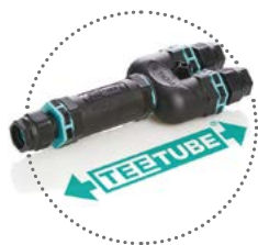
Giunti Circolari di Derivazione