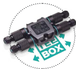
Distributori di Corrente Presa-Spina