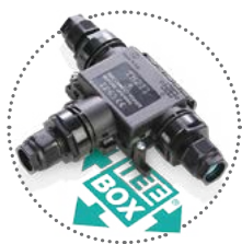
Scatole di Derivazione